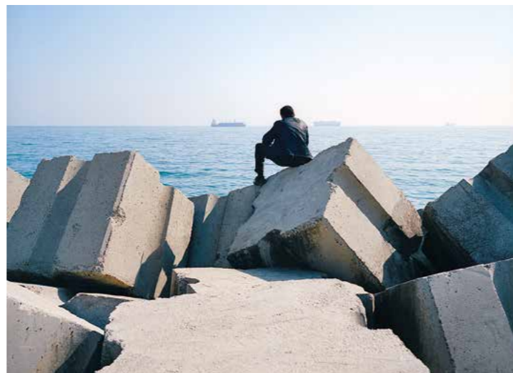
Kader Attia, Rochers Carrés , 2008. Series of silver prints.

Das Symposium „Planetarische Utopien – Hoffnung, Sehnsucht, Imagination in einer post-kolonialen Welt“ ist ein Versuch, sich ausgehend vom (Nicht-)Ort der Planetarität eine postimperiale Politik vorzustellen. Dazu müssen wir uns auf die Offenheit planetarischer Utopien einlassen und nicht nur über das nachdenken,